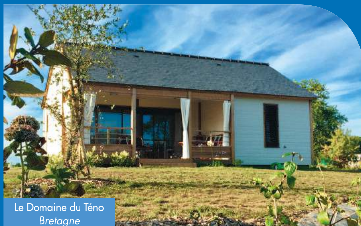
Le Domaine du Téo Bretagne