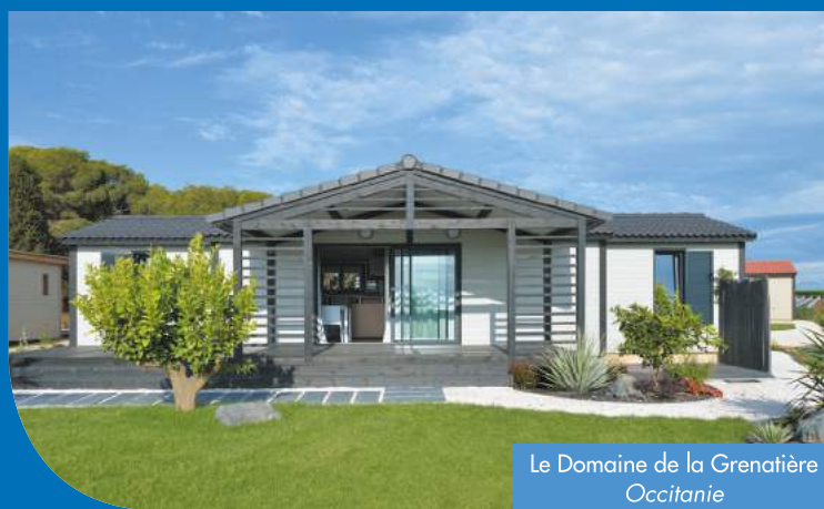
Le Domaine de la Grenatière Occitanie