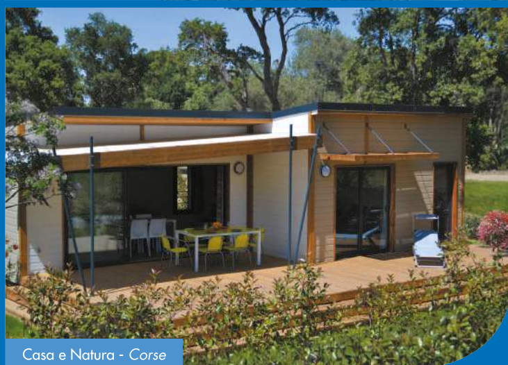
Casa e Natura - Corse