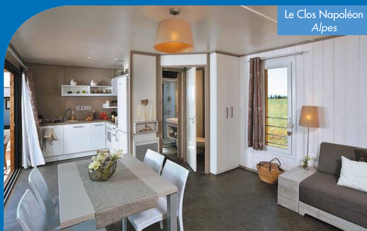
Le Clos Napoléon Alpes